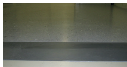
optional: abgeschrägte Anschlusskanten erhältlich bevelled edge available