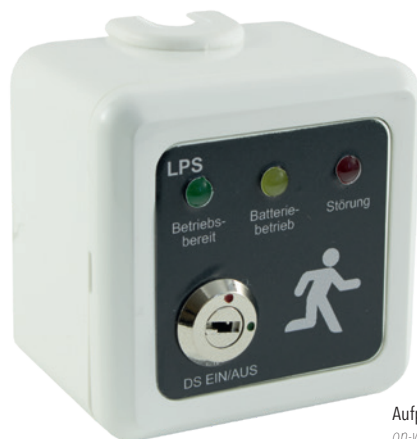
Aufputzmontage on-wall mounting