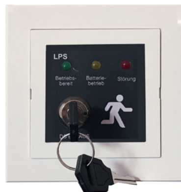
Unterputzmontage wall installation